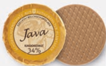
Java | 34 % Kakao