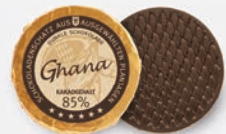
Ghana | 85 % Kakao