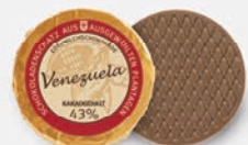
Venezuela | 43 % Kakao