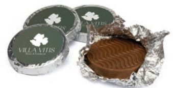
25 SCHOKOTALER Vollmilch- oder Zartbitterschokolade individualisierbares Etikett