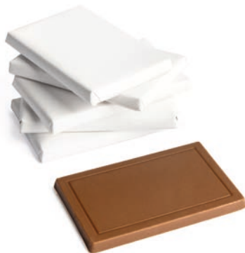
25 TÄFELCHEN Vollmilchschokolade individualisierbare Banderole