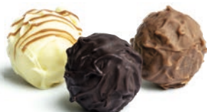
TRÜFFEL / 300 G Verschiedene Sorten mit Alkohol

verschiedene Befüllungen möglich Von der Idee über die Design-erstellung und Produktion bis hin zum Einzelversand. DreiMeister Service aus einer Hand. Fordern Sie jetzt ihr persönliches Angebot an!