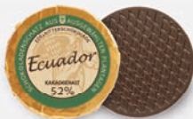
Ecuador | 52 % Kakao