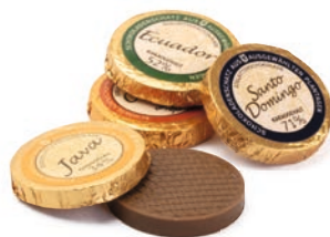
25 GOLDDUBLONEN 6 Sorten Schokolade von Vollmilch bis Zartbitter