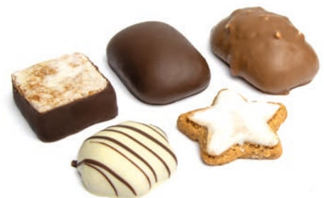
GEBÄCKMISCHUNG / 300 G verschiedenes Weihnachtsgebäck

verschiedene Befüllungen möglich Von der Idee über die Design-erstellung und Produktion bis hin zum Einzelversand. DreiMeister Service aus einer Hand. Fordern Sie jetzt ihr persönliches Angebot an!