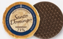
Santo Domingo | 71 % Kakao