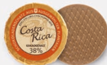
Costa Rica | 38 % Kakao